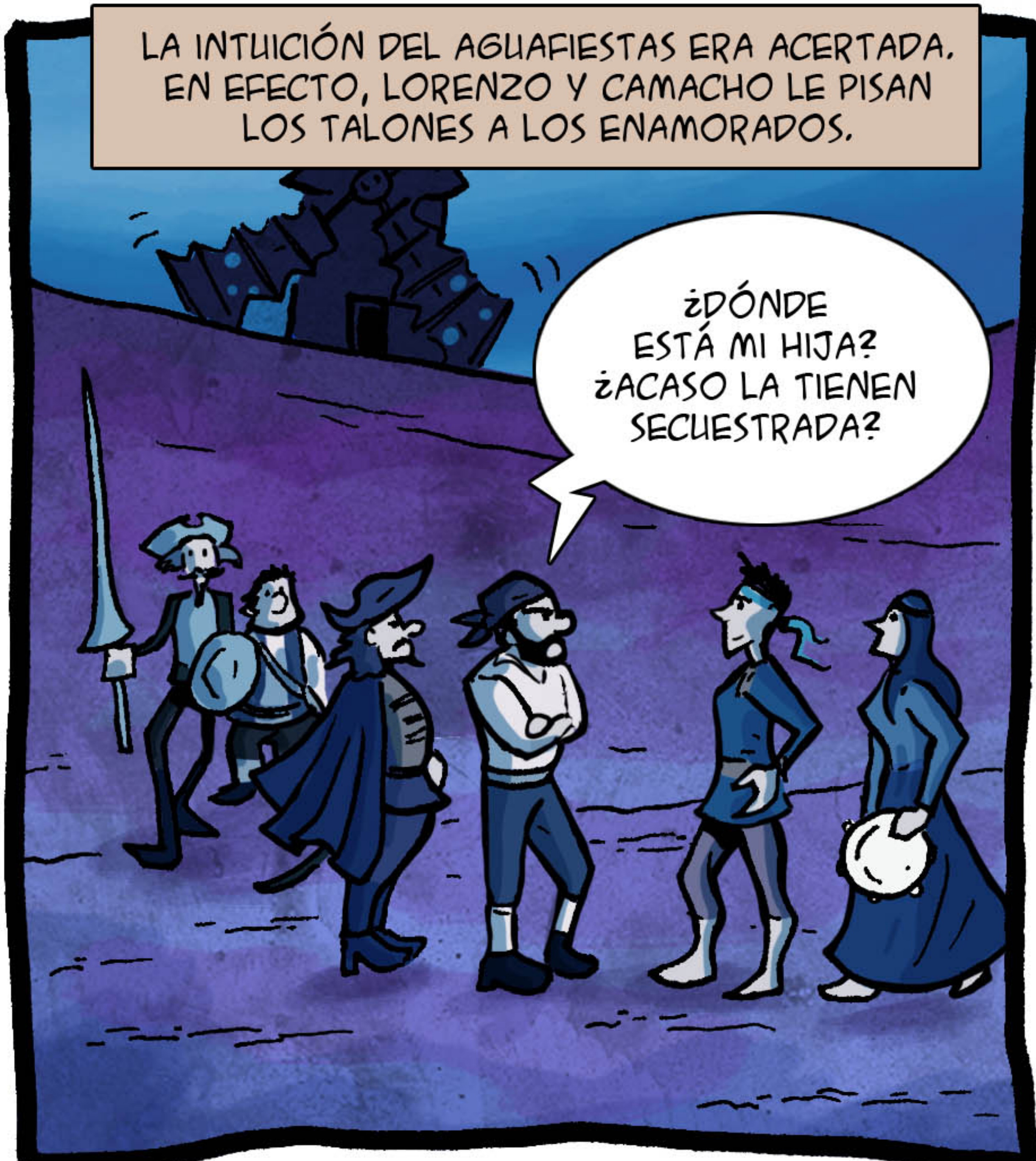
LA INTUICIÓN DEL AGUAFIESTAS ERA ACERTADA. EN EFECTO, LORENZO Y CAMACHO LE PISAN LOS TALONES A LOS ENAMORADOS.

¿DÓNDE ESTÁ MI HIJA? ¿ACASO LA TIENEN SECUESTRADA?