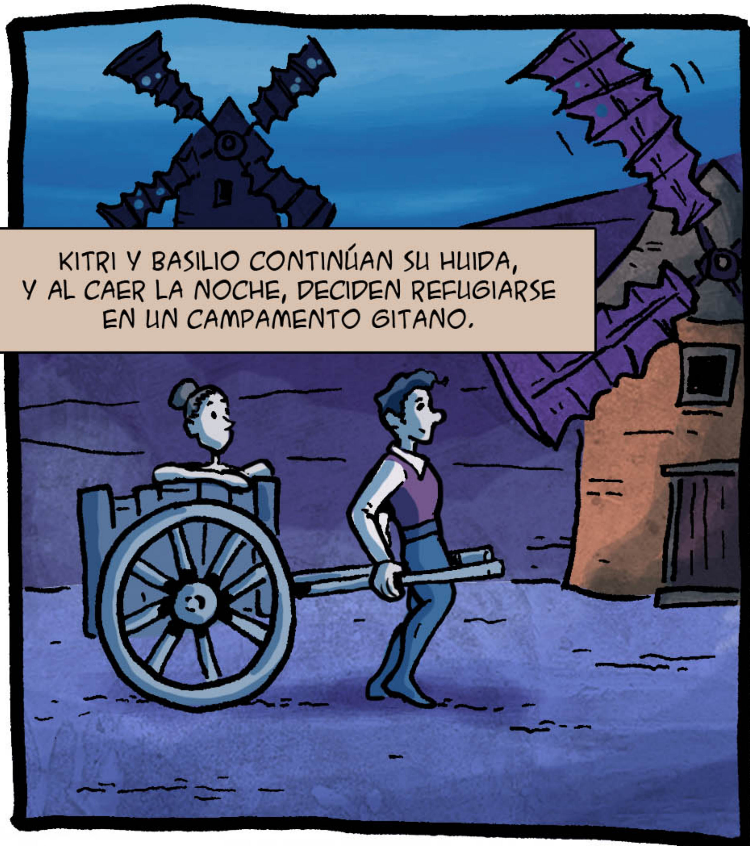
KITRI Y BASILIO CONTINÚAN SU HUIDA, Y AL CAER LA NOCHE, DECIDEN REFUGIARSE EN UN CAMPAMENTO GITANO.