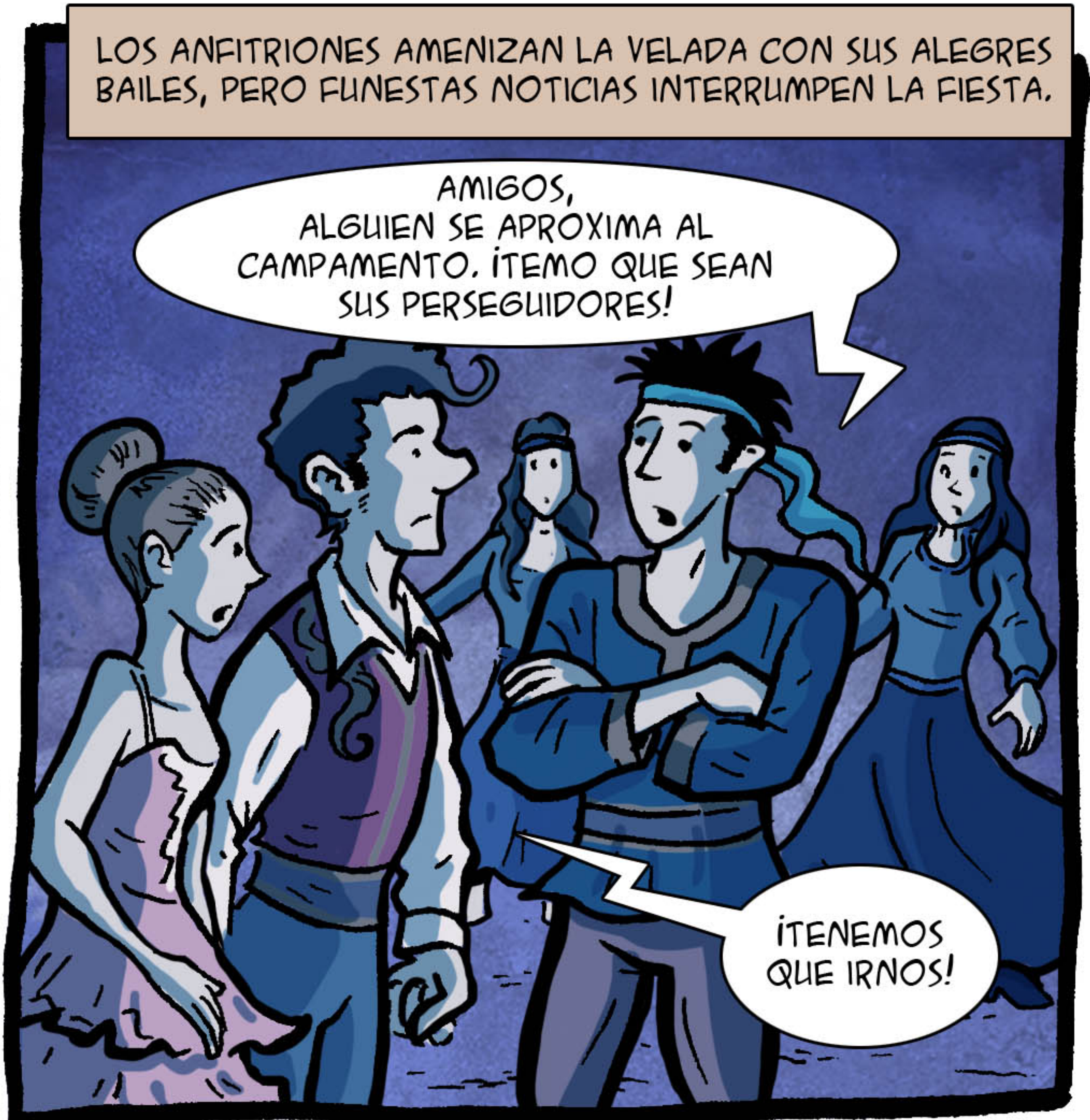
LOS ANFITRIONES AMENIZAN LA VELADA CON SUS ALEGRES BAILES, PERO FUNESTAS NOTICIAS INTERRUMPEN LA FIESTA.

AMIGOS, ALGUIEN SE APROXIMA AL CAMPAMENTO. ÍTEMO QUE SEAN SUS PERSEGUIDORES!