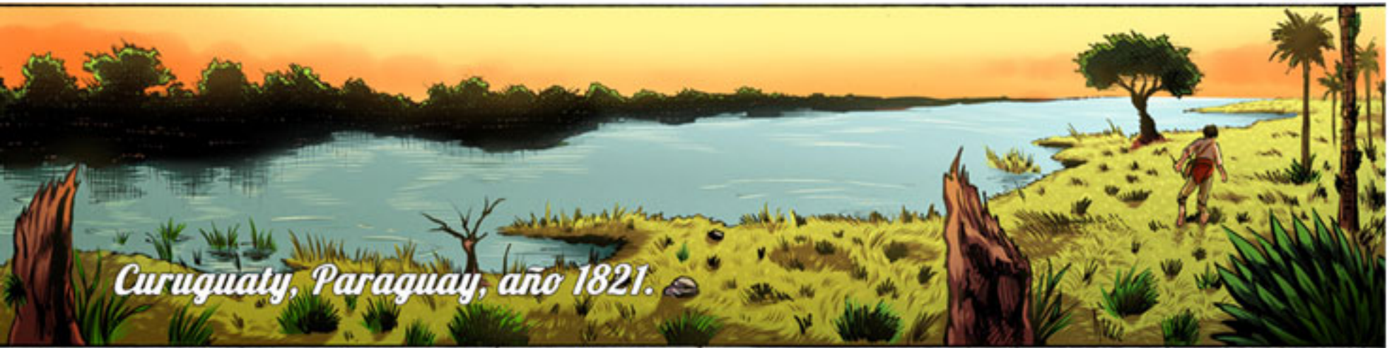
Curuguaty, Paraguay, año 1821.